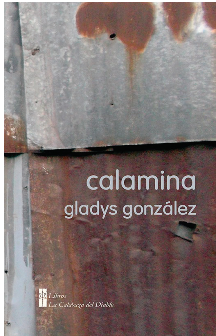
Portada de Calamina . La Calabaza del Diablo, 2014.

Así puede verse en un fragmento del poema “ Habitaciones ” de Calamina :