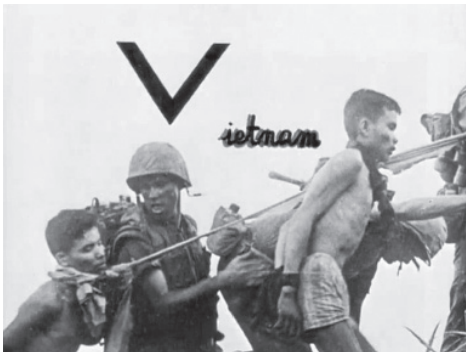
Figura 1. Fotograma de Le Gai Savoir .

un corazón sino encadenar argumentos; lo verbal sofoca a lo visual” (61). Nosotros, siguiendo lo que Deleuze dice de los conceptos, podemos ver como esta imagen tiene una historia que va del registro de las imágenes y los sonidos (“los planos filmados por la tituladora”) a su composición (“ordenamiento semántico”); pero también un devenir que va de su composición a su descomposición para, posteriormente, volverse a componer con otros elementos. Así, más que un “sofocamiento” de lo visual por medio de lo verbal hay un hacer y rehacer dionisiaco, una práctica textual similar a la que Barthes y Kristeva preconizan en sus propuestas semióticas. En S/Z Barthes ejecuta en el análisis de Sarrasine de Balzac una práctica textual descompositiva compositiva que muestra un haz de diferencias: “una diferencia que no se detiene y se articula con el infinito de los textos, de los lenguajes, de los sistemas” (1). Julia Kristeva, por su parte, acude al término de intertextualidad para explicar el modo en que todo texto pone en práctica otros textos: “todo texto se construye como mosaico de citas, todo texto es absorción y transformación de otro texto. En lugar de la noción de intersubjetividad se instala la de intertextualidad” (190) Para nosotros, esta imagen de la Fig. 1 nos sirve para extraer de su interior su práctica extratextual, su concepto, para ver cómo funciona su mecanismo en el ámbito filosófico y para, en definitiva, constatar el funcionamiento de las multiplicidades.